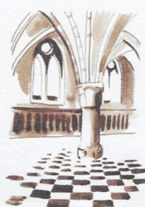
K Le réfectoire des convers