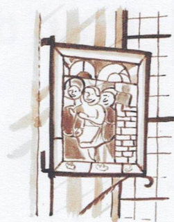
J Les cuisines des moines