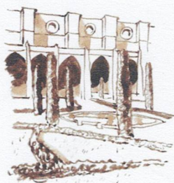
F Le jardin du cloître