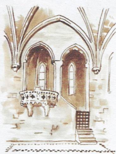
L Le réfectoire des moines