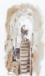
N Le bâtiment des latrines