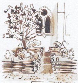
G Le Jardin des 9 carrés