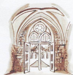
M Le passage parlour