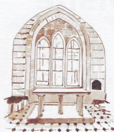
I La sacristie / exposition